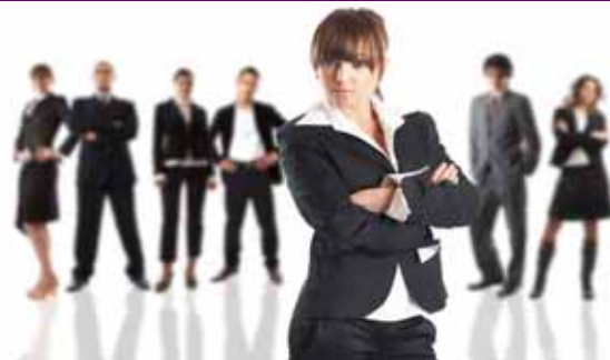
Erfahren Sie, wie Sie sich mithilfe von psychologischem Fachwissen den Umgang mit Vorgesetzten, Geschäftspartnern und Kollegen erleichtern.