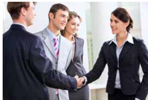
Lernen Sie, versteckte Botschaften Ihres Gegenübers zu erkennen.

In diesem Seminar lernen Sie, sensibler zu kommunizieren und Ihr Auftreten zu verbessern. Erfahren Sie auch, wie Sie die nonverbalen Zeichen Ihres Gegenübers richtig deuten und wie Sie Konfliktsituationen aktiv steuern und ausbremsen können.